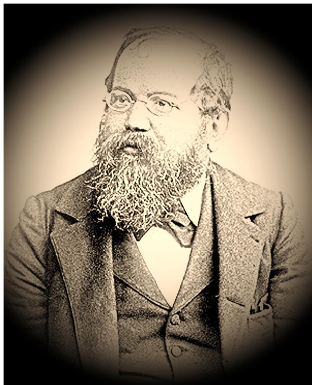
Wilhelm Steinitz Schachweltmeister von 1886 bis 1894

Kommentar SBRN (03.02.2019, Landsmann ): geprüft [ Bemerkung ] [ Löschen ] [ Ergebnis bestätigen ]